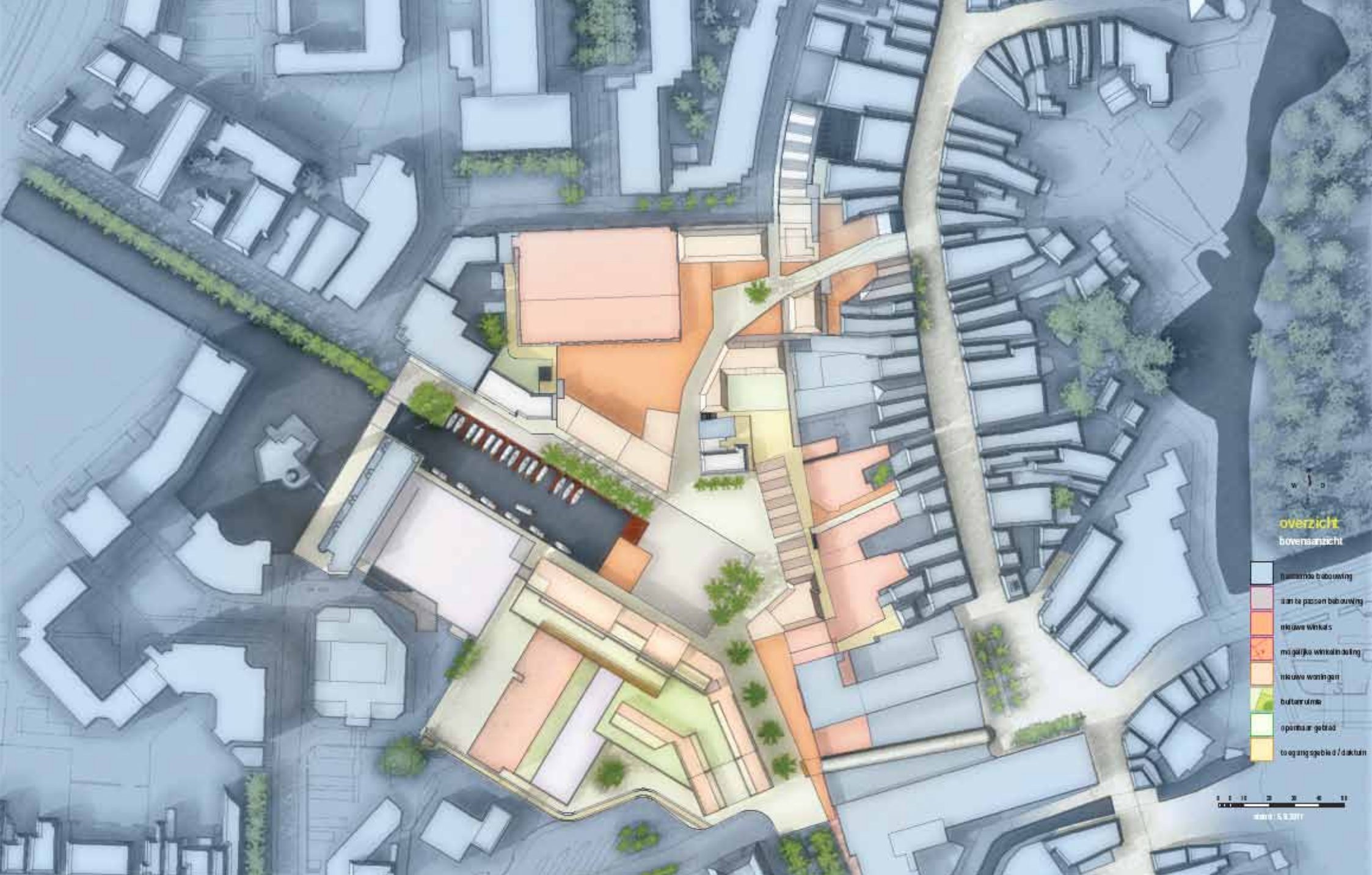
Figuur 1: Plangebied van de Visie voor de binnenstad Almelo, 22 november 2011