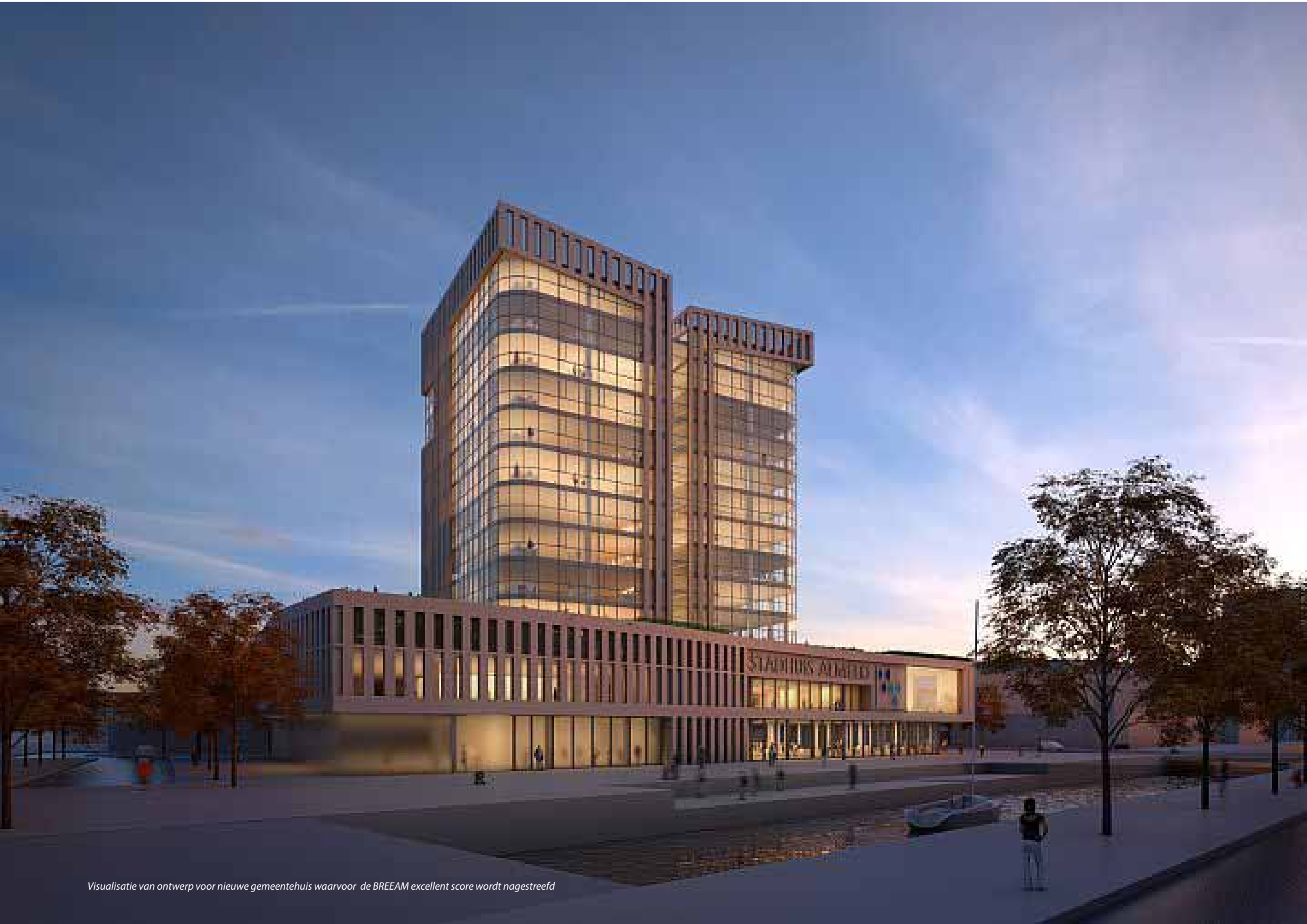
Visualisatie van ontwerp voor nieuwe gemeentehuis waarvoor de BREEAM excellent score wordt nagestreefd