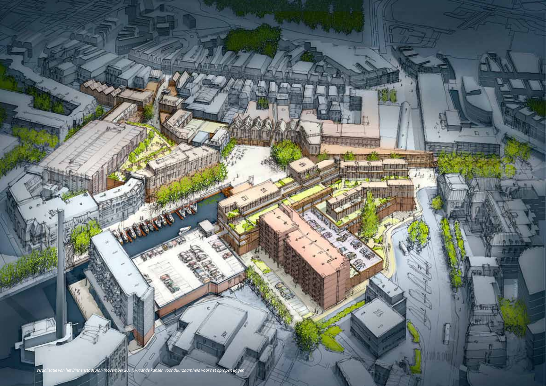
Visualisatie van het Binnenstadsplan (november 2011) waar de kansen voor duurzaamheid voor het oprapen liggen